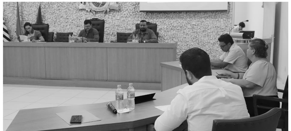
Nas próximas sessões, os vereadores vão votar crédito adicional resultante de emenda parlamentar do deputado Arnaldo Jardim

De acordo com a Lei Orçamentária Anual (LOA), o Poder Executivo está autorizado a cobrir créditos adicionais até o limite de 15% dos recursos anuais, sem aval do Legislativo. Como a previsão orçamentária de 2026 é de R$ 207,3 milhões, o valor que corresponde a essa porcentagem é de R$ 31 milhões.