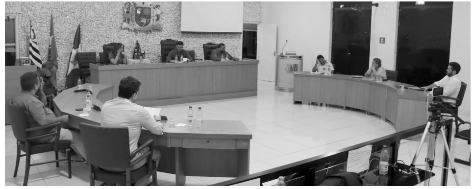
A expansão aprovada permite futuro loteamento que fica nas imediações do Jardim América