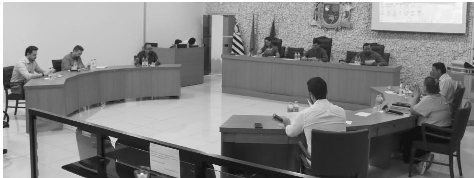
A matéria foi votada na primeira sessão realizada segunda-feira (06) e recebeu unanimidade de votos