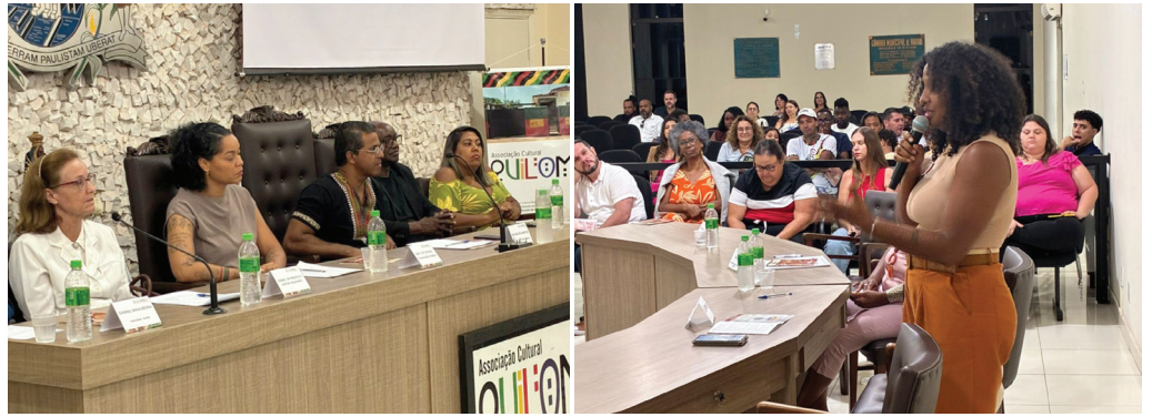
Autoridades e público presente no lançamento do curso, dia 2, na Câmara Municipal

culdade de Arquitetura, Artes, Comunicação e Design (FAAC), da Universidade Estadual Paulista "Júlio Mesquita Filho" (UNESP), campus de Bauru, e tem como objetivo ampliar o acesso ao conhecimento sobre relações étnico-raciais, promovendo reflexão e formação crítica.