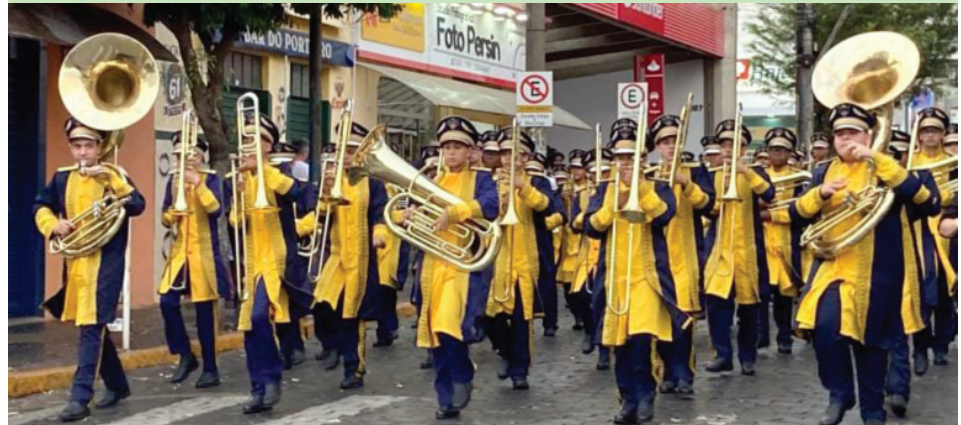
Os integrantes da Banda Marcial devem receber vale alimentação de R$ 150 mensais