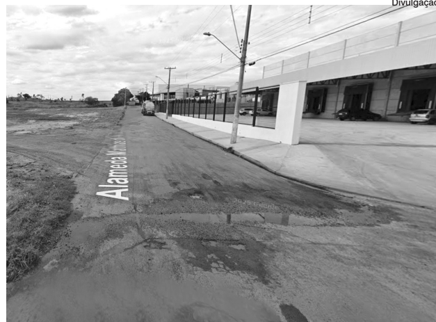
Alameda Mathias de Alice receberá obras de drenagem e de recapeamento

O objetivo é melhorar o escoamento das águas da chuva, eliminar pontos de alagamento, preservar a infraestrutura viária e garantir mais segurança para as atividades industriais da região.