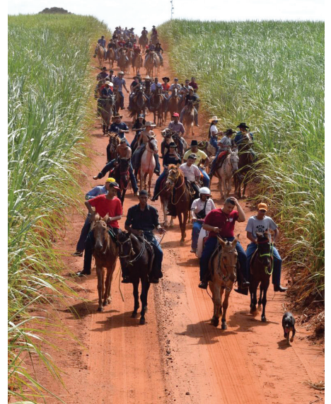
Cavalgada Rural será realizada no domingo, dia 12, a partir das 9h

Após a realização da cavalgada será realizado um almoço especial com animação da dupla Luiz Vicente e Luizinho. Para os cavaleiros participantes o almoço gratuito; para de-