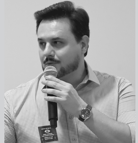
As propostas de Crepaldi versam sobre programa domiciliar de atendimento ao idoso; de proteção à primeira infância, além da criação de ambientes cardioprotégidos

O projeto 14/2026 institui a política municipal de incentivo à criação de ambientes cardioprotégidos em Bariri. Para tanto, a proposta promove a capacitação em re-