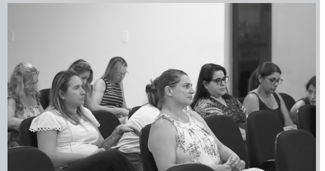
Parte do público presente à sessão foi formada por representantes do magistério municipal